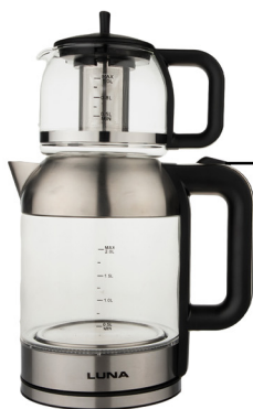
کلید جوشاندن آب

روی محصول یک کلید جوشاندن آب وجود دارد که با فشردن آن آب شروع به جوشیدن میکند و پس از به جوش آمدن آب کلید به وضعیت قبلی باز میگردد و برای استفاده های بعدی آماده است.